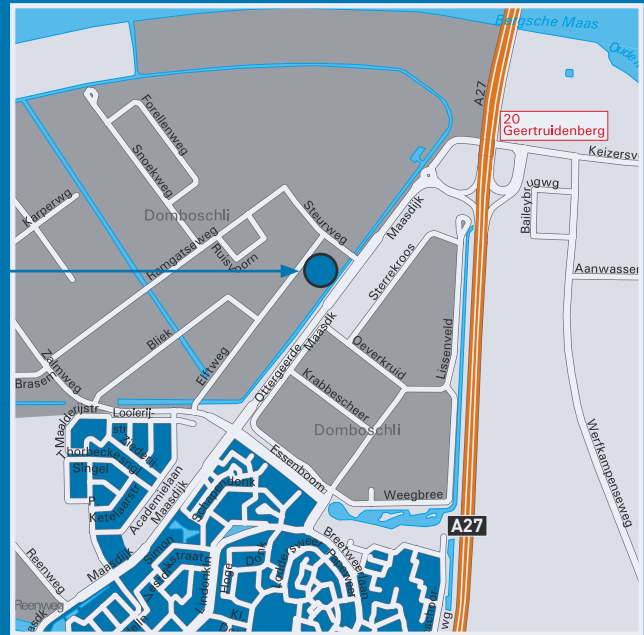
ELFTWEG 32 T/M 54